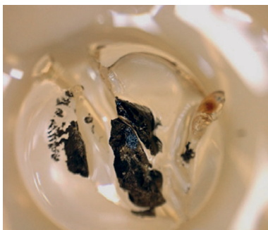
7. ábra. Oxigénfejlődés akrilgyöngyben (ezüst-nitrát-oldat elektrolízise)