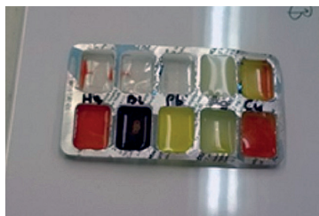
3. ábra. A tablettartató mint reakciótér

ban, akár nagy létszámú osztályok esetében is. Két nehézség szokott felmerülni: nem lehet napokkal előre előkészíteni a kísérletet, mert a kis anyagmennyiségek miatt előfordulhat, hogy az oldatok beszáradnak. A tanulóktól bizonyos fokú önmérsékletet és jártasságot követel meg, törekedniük kell a túltöltés elkerülésére – annak érdekében, hogy a szomszédos mélyedésekben lévő reagensek ne keveredjenek egymással. Tablettartókban mindazok a csapadékképződéssel járó, közömbösítési és gázfejlődéssel járó reakciók elvégezhetők, amelyek a mikroszkópi módszerek bemutatásáról szóló részben szerepelnek (3. ábra).