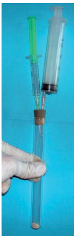
2. ábra. Acetilén előállítását kalcium-karbid és víz reakciójával

készüléket úgy tartjuk, hogy néhány ujjunkkal a gumidugót enyhén szorítsuk a kémcsőhöz! Lassan – cseppenként! – kezdjük el a \text{H}_2\text{O}_2 adagolását! Megindul az oxigénfejlődés, mivel a \text{MnO}_2 katalizálja a hidrogén-peroxid bomlását: 2 \text{H}_2\text{O}_2 \rightarrow 2 \text{H}_2\text{O} + \text{O}_2 . Minden egyes csepp beadása után enyhén húzzuk meg a gázfelfogó fecskendő dugattyúját! Folytassuk a gázfejlesztést, míg a gázfelfogó fecskendő meg nem telik! Az első adag gázt engedjük a levegőbe! A második adag már kellően tiszta ahhoz, hogy biztonságosan kísérletezzünk vele.